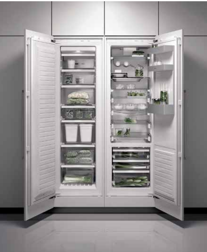
Rentaplats Rentaplats integrable Gaggenau.